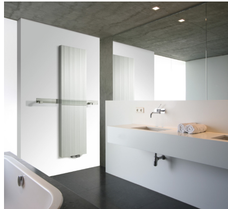
Ausgezeichnetes Ecodesign: Der Bryce Plus vereint Optik, Technologie und Umweltschutz in sich.