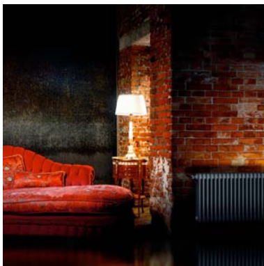
Der authentische Vintage Typ 50 passt sich dem individuellen Einrichtungsstil an.