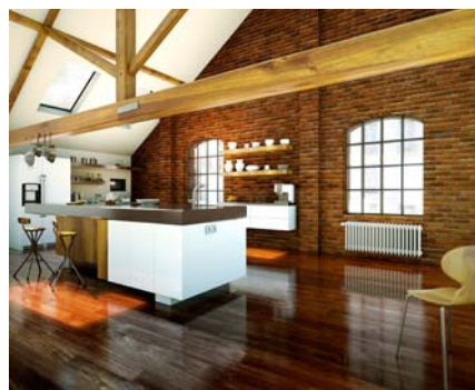
Der Gliederheizkörper Vintage bietet sich etwa für geräumige Küchen an. Er harmoniert sehr gut mit modernen Einrichtungsgegenständen.